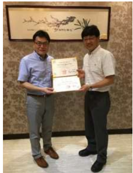
【TASSW 会長より FASSW 会長への大会参加感謝状】

2017年10月23日-25日に FASSW 運営委員6名と一緒に台湾の SSW 活用事業視察に訪問した。視察訪問内容は、以下の通りである。